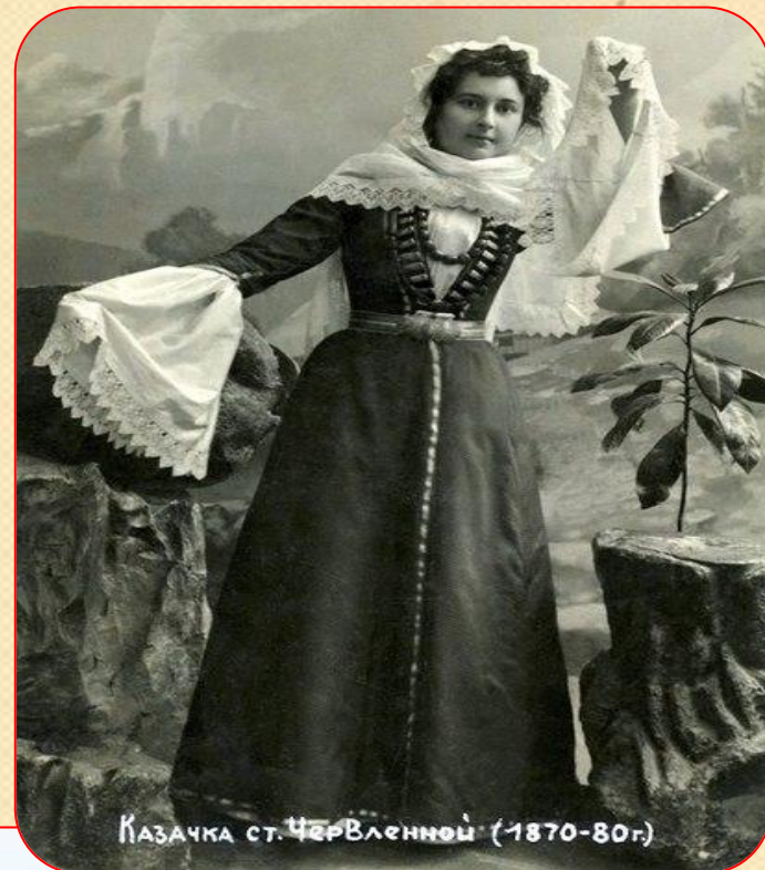
Казачка ст. Червленной (1870-80г)

Женская одежда различалась у казачек, согласно существовавши м традициям, по месту их происхождения