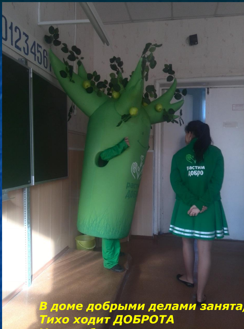
В доме добрыми делами занята, Тихо ходит ДОБРОТА Утро доброе у нас Добрый день и добрый час!