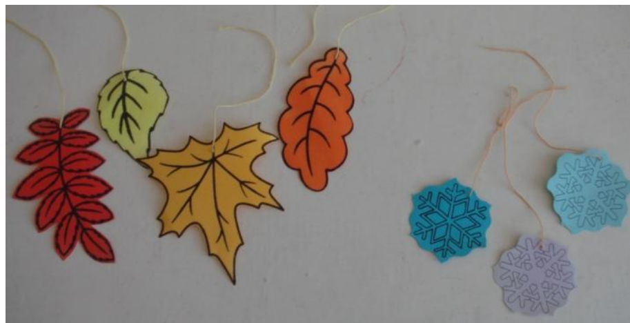
«Подуй на листик (снежинку)»