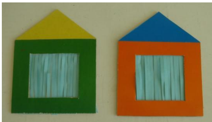
«Подуй на занавеску»