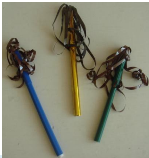
«Подуй на султанчик»