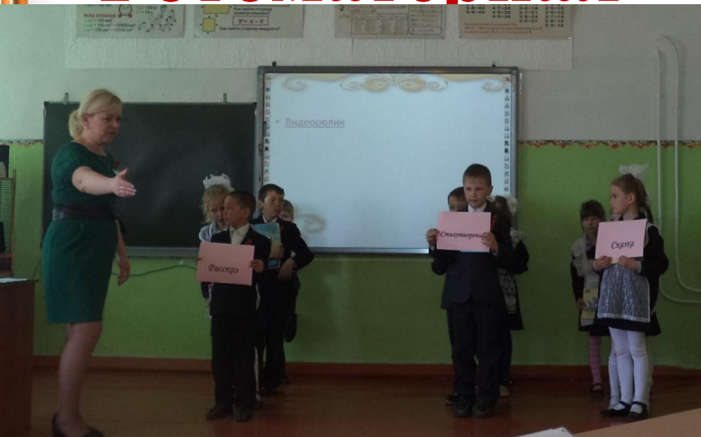
Фрагмент занятия в 1 классе «Ресурсный круг»