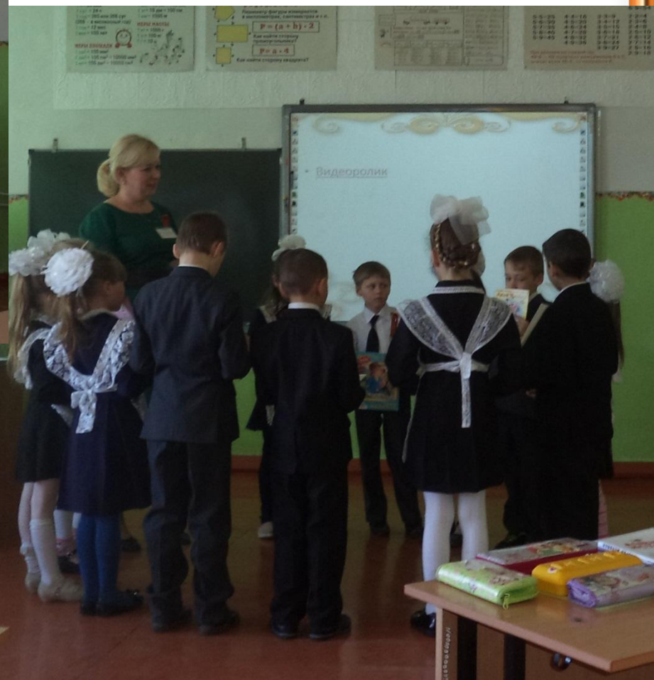
Занятие в 1 классе «Книга»