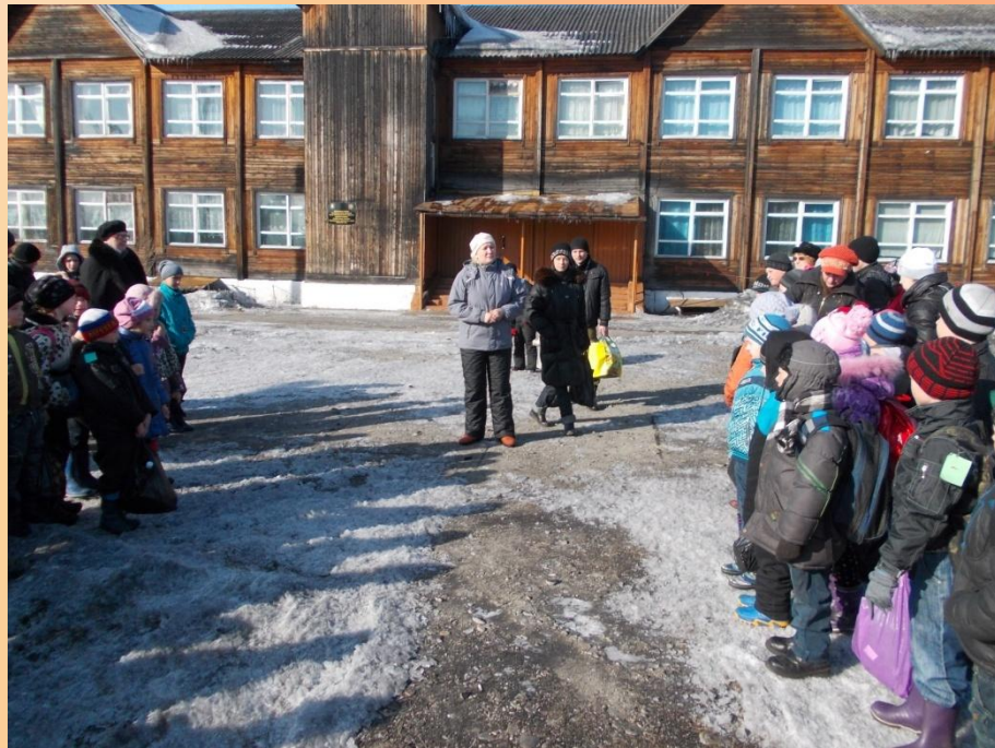
Возложение цветов к памятнику Володи Дубинина