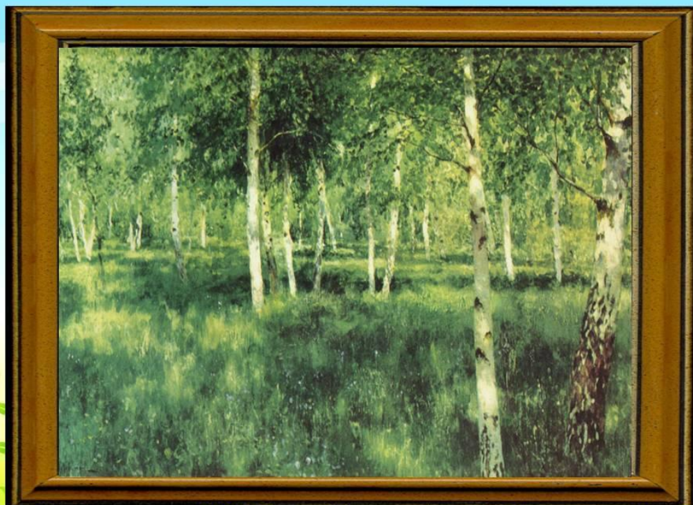
И. Левитан "Березовая роща"