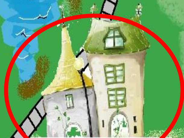
Город Ребусов и Пословиц