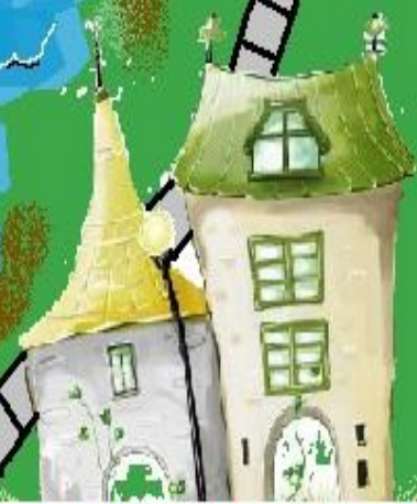
Город Ребусов и Пословиц