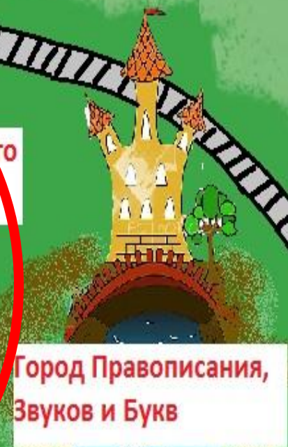
Город Правописания, Звуков и Букв