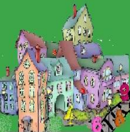
Город Сложения и Вычитания