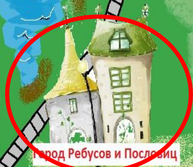
Город Ребусов и Пословиц