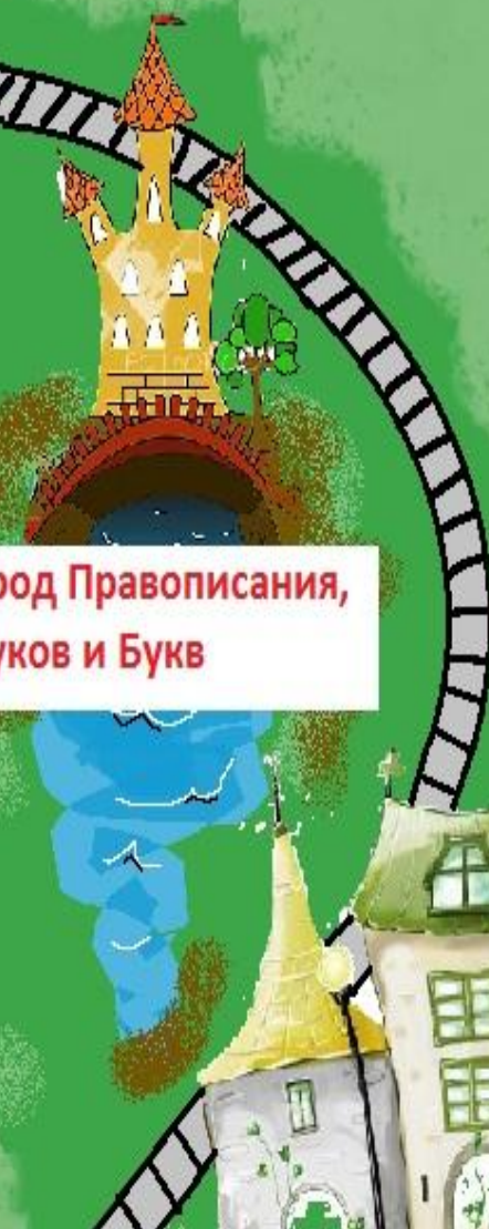
Город Правописания, Звуков и Букв