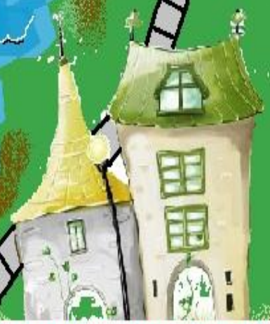
Город Ребусов и Пословиц