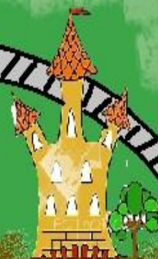
Город Правописания, Звуков и Букв