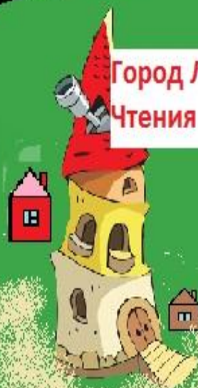
Город Литературного Чтения