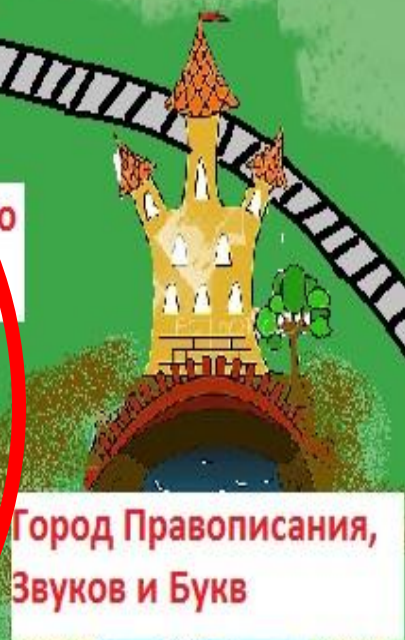
Город Правописания, Звуков и Букв