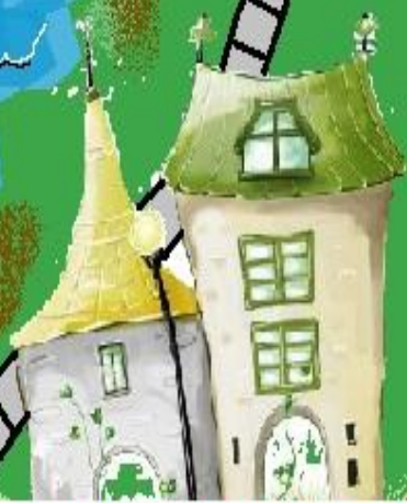
Город Ребусов и Пословиц