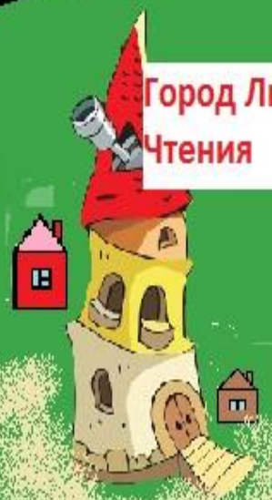
Город Литературного Чтения