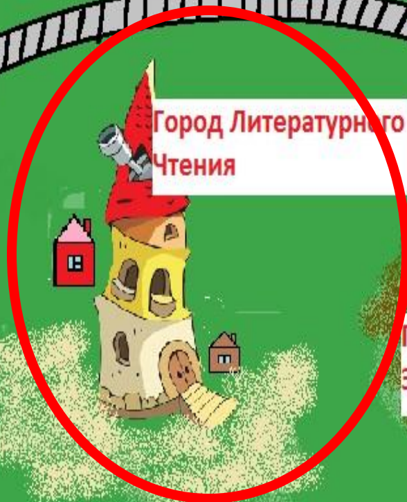
Город Литературного Чтения