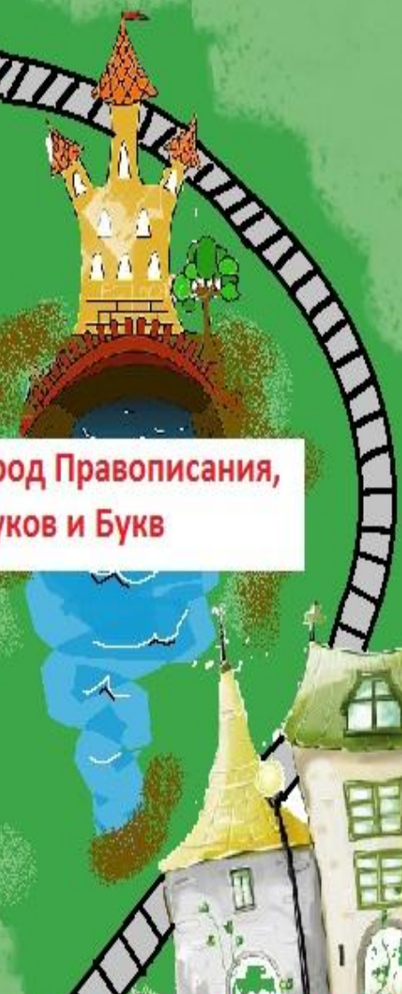
Город Правописания, Звуков и Букв