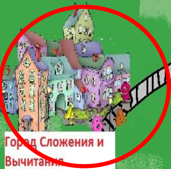
Город Сложения и Вычитания