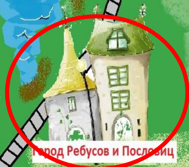
Город Ребусов и Пословиц