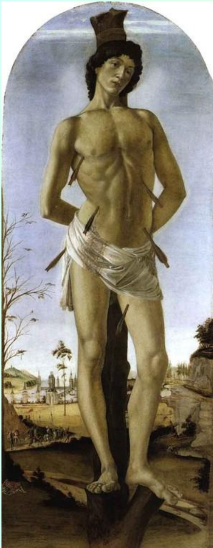
Св.Себастьян Сандро Биттичелли