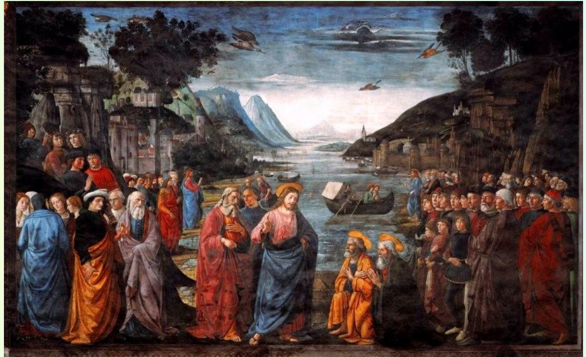
Обучение апостолов Доминико Гирландайо