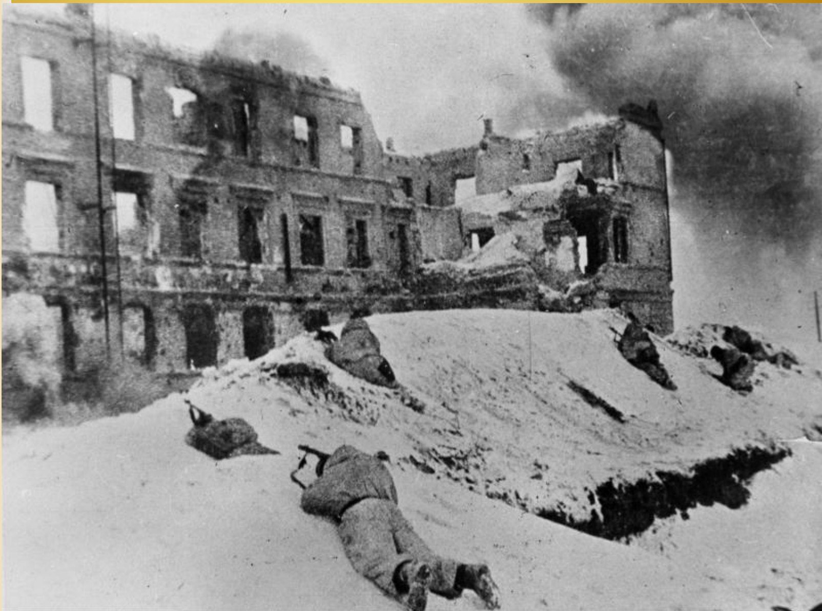
Bild 183-P0613-308 Januar 1943