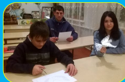
Круглий стіл "Ми за МИР!"