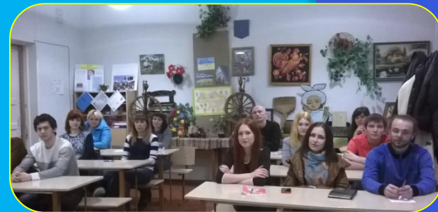
Бесіда "Правила поведінки під час зимових канікул"