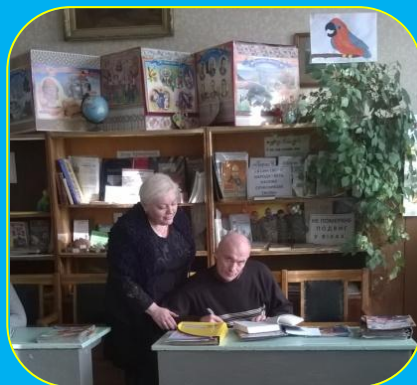
Робота в бібліотеці