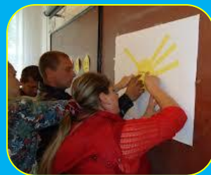
Виховна година "Толерантність"