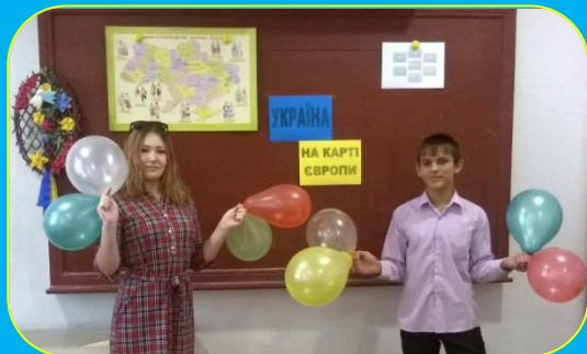
Перший урок "Україна на карті Європи"