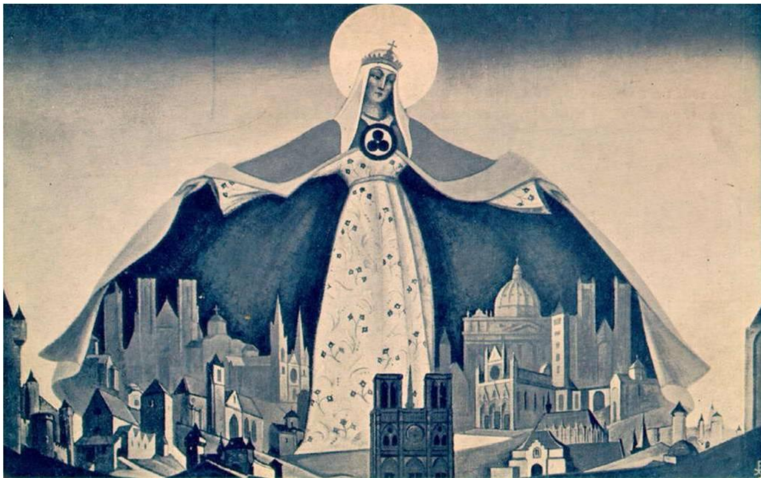
Мадонна – Защитница. 1933 г.