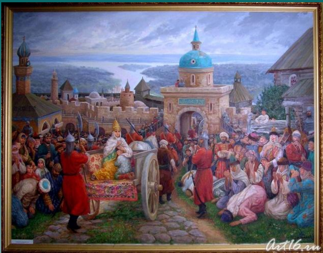
«Сөембикә белән саубуллашу» (Рәссам – Ф. Халиков)