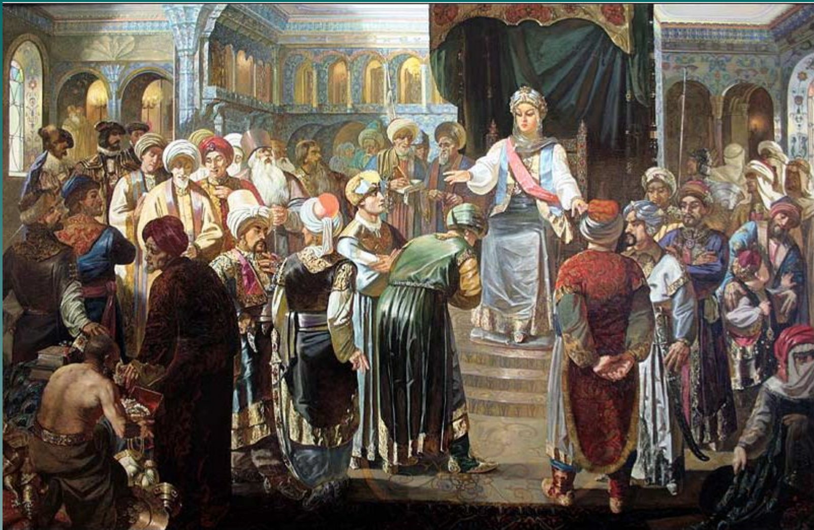
«Казан ханбикәсе Сөембикә янында» (рәссам - Ильяс Фәйзуллин)