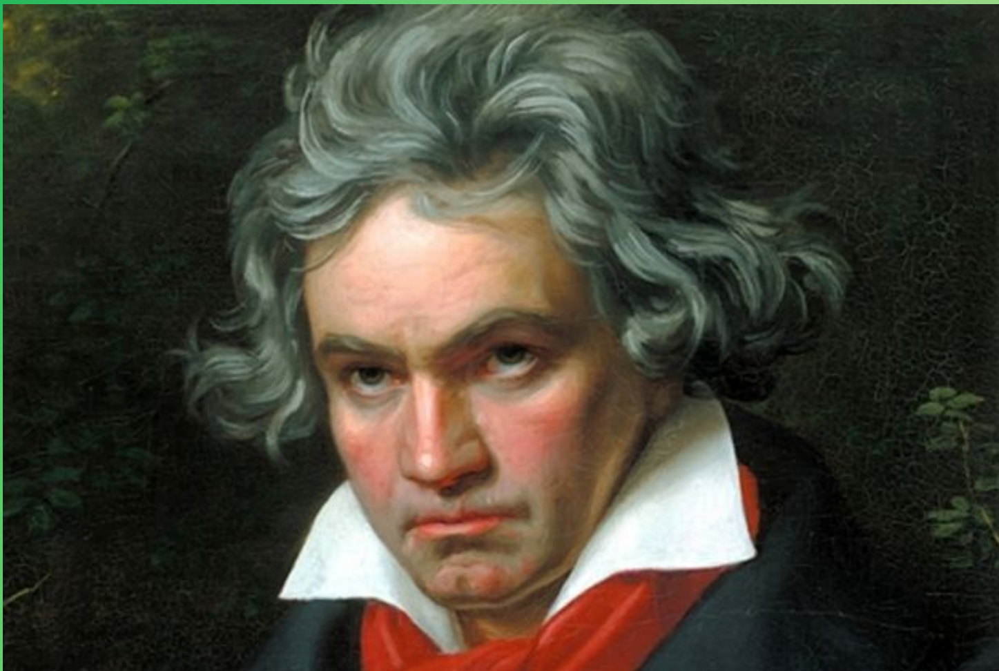
Людвиг Ван Бетховен (1770-1827)