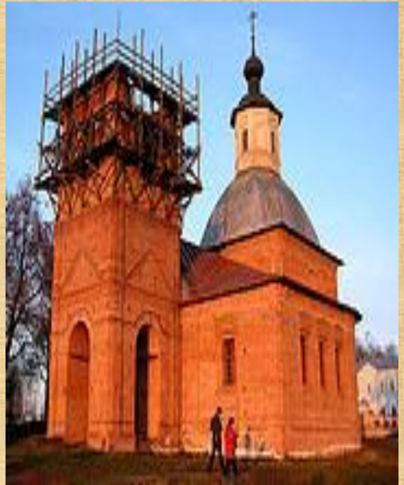
В 2006 году была восстановлена колокольня