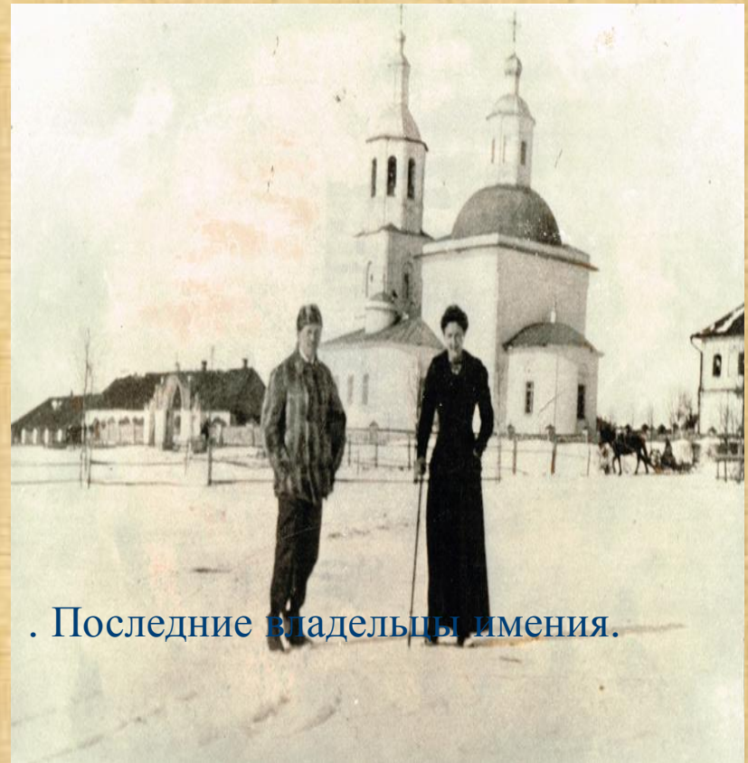
. Последние владельцы имения.

На рубеже XVIII – XIX веков в Хмелите было три храма. У самого въезда в парадный двор располагалась каменная церковь в честь Казанской иконы Божьей Матери с приделами во имя Иоанна Предтечи и святителя Николая Чудотворца с двухъярусной колокольней.