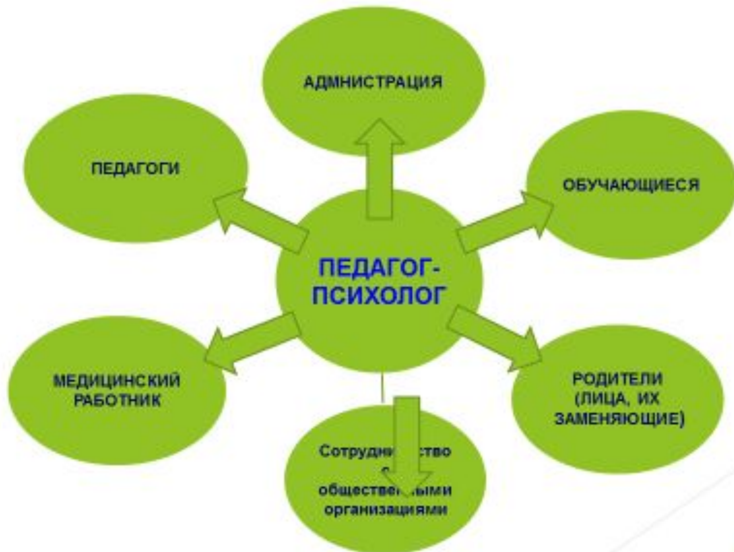
Схема взаимодействия педагога-психолога