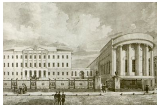
Московский университет и Татьянинская домовая церковь в 1848г.