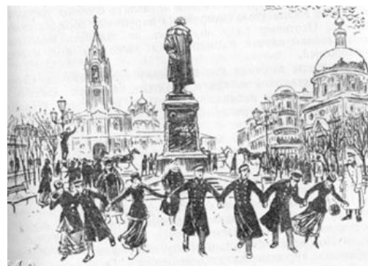
Студенческое гулянье на Тверском бульваре