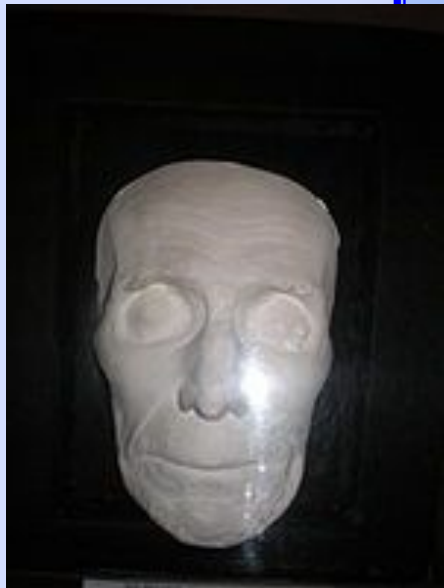
Посмертная маска А.В.Суворова

6 (18) мая 1800г. во втором часу дня Александр Васильевич Суворов скончался по адресу Крюков канал, дом 21, город Санкт-Петербург. Полководец был похоронен в Нижней Благовещенской церкви Александра-Невской лавры при огромном скоплении народа.