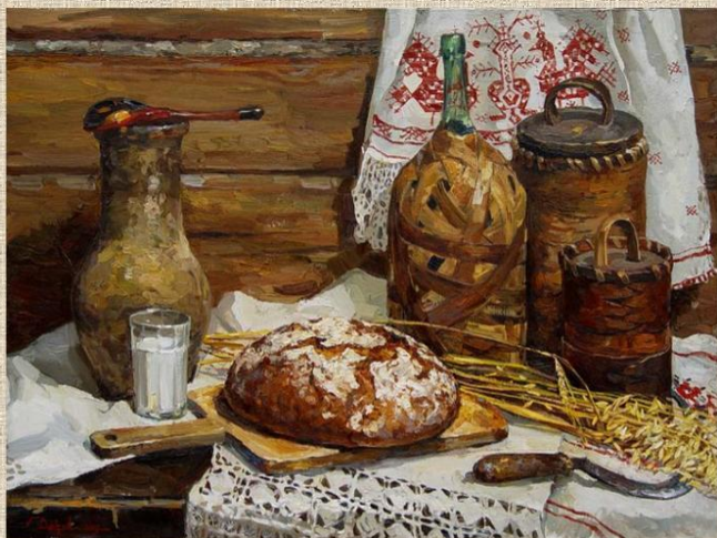
К. ДАЦУК «ХЛЕБ РУССКОГО СЕВЕРА»