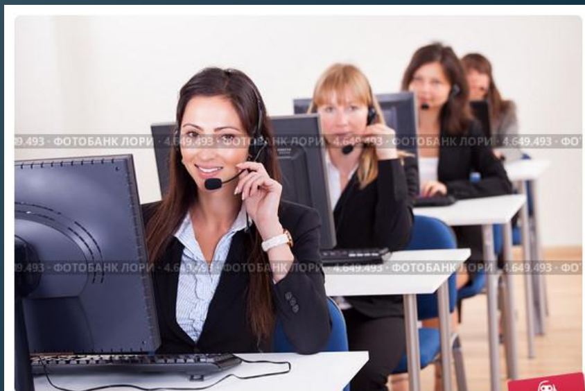
Коллектив работников группы поддержки на рабочих местах