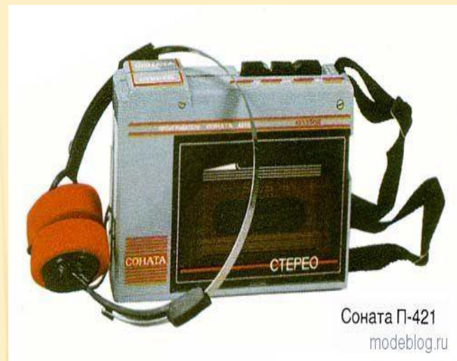
Соната П-421 modeblog.ru