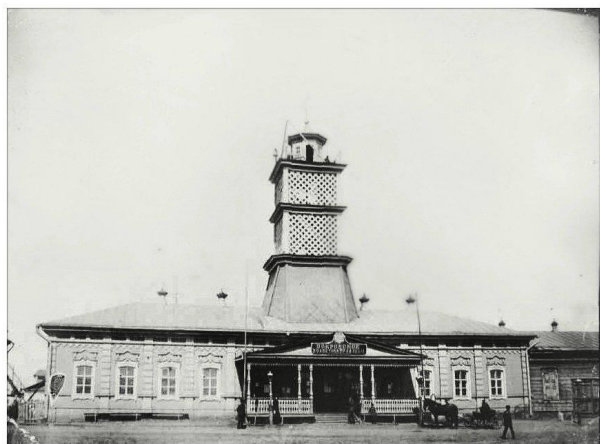
Пожарная каланча и здание Волостного правления, 1908 г