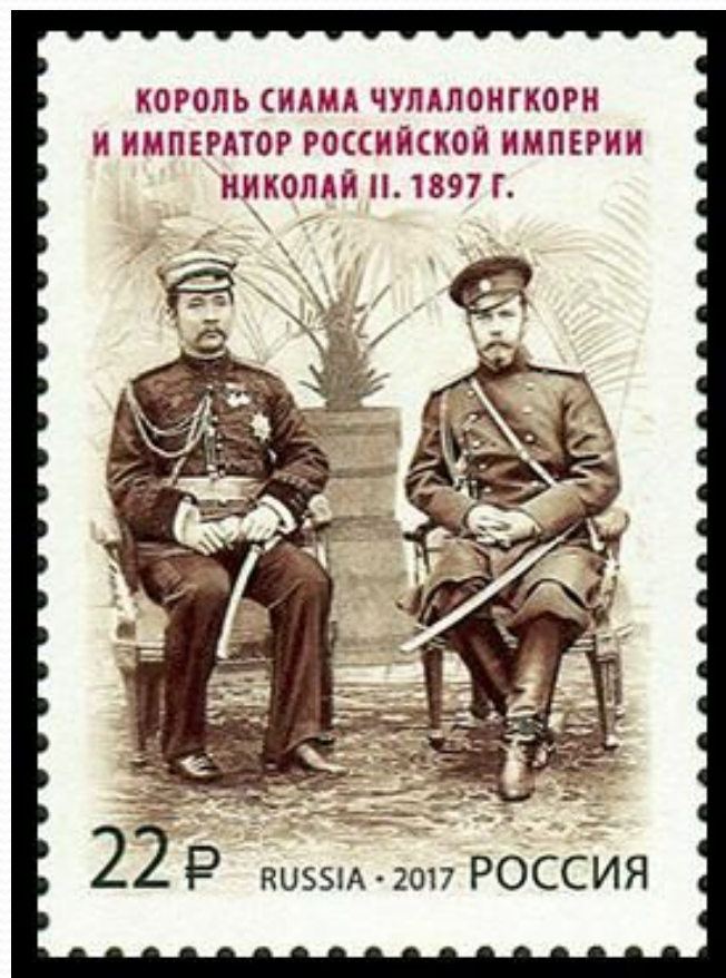
Николай II и Король Таиланда Рама V Чулалонгкорн