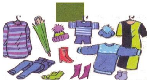
Товары и услуги