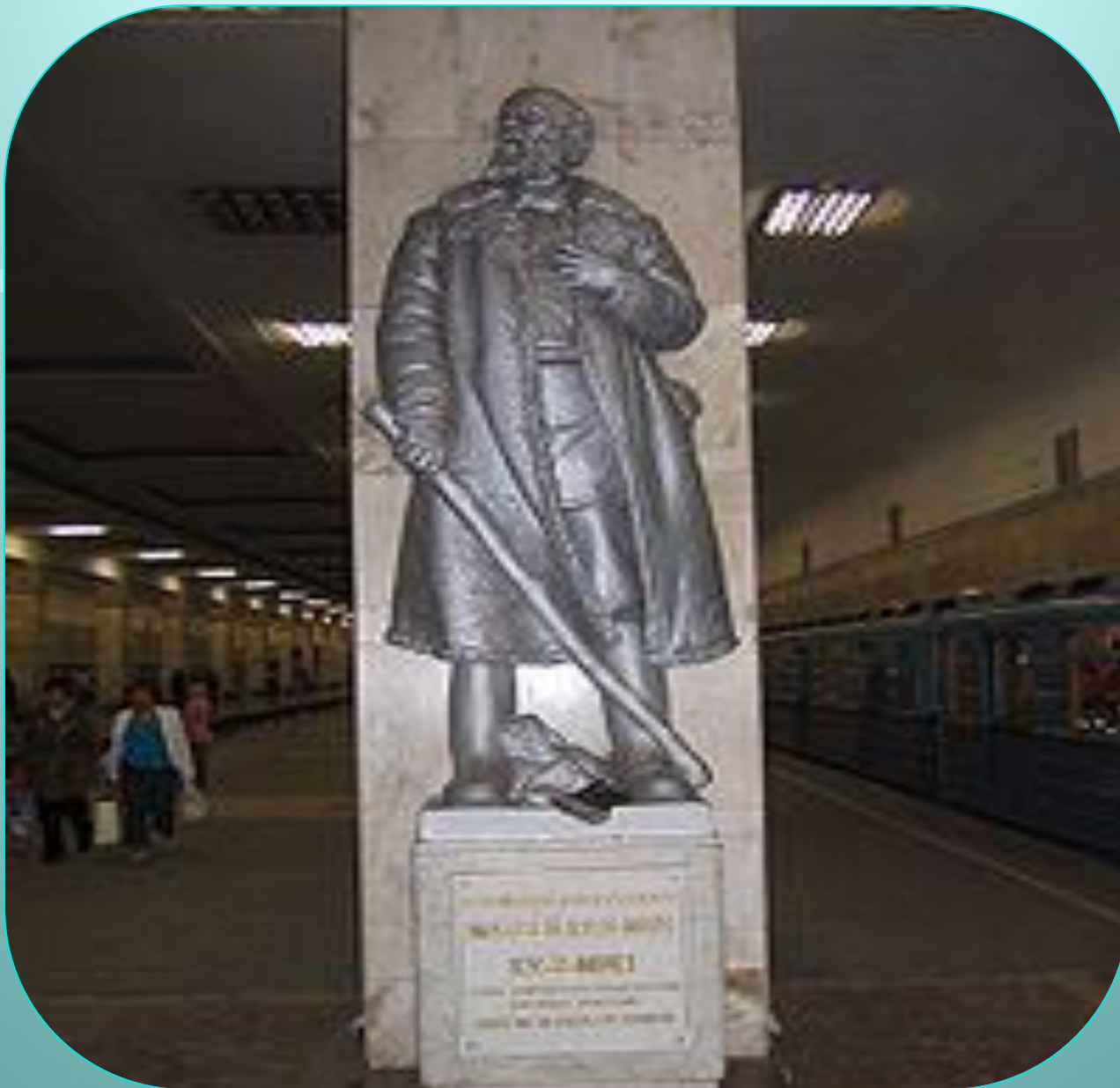
Памятник Матвею Кузьмину на станции «Партизанская» Московского метрополитена.