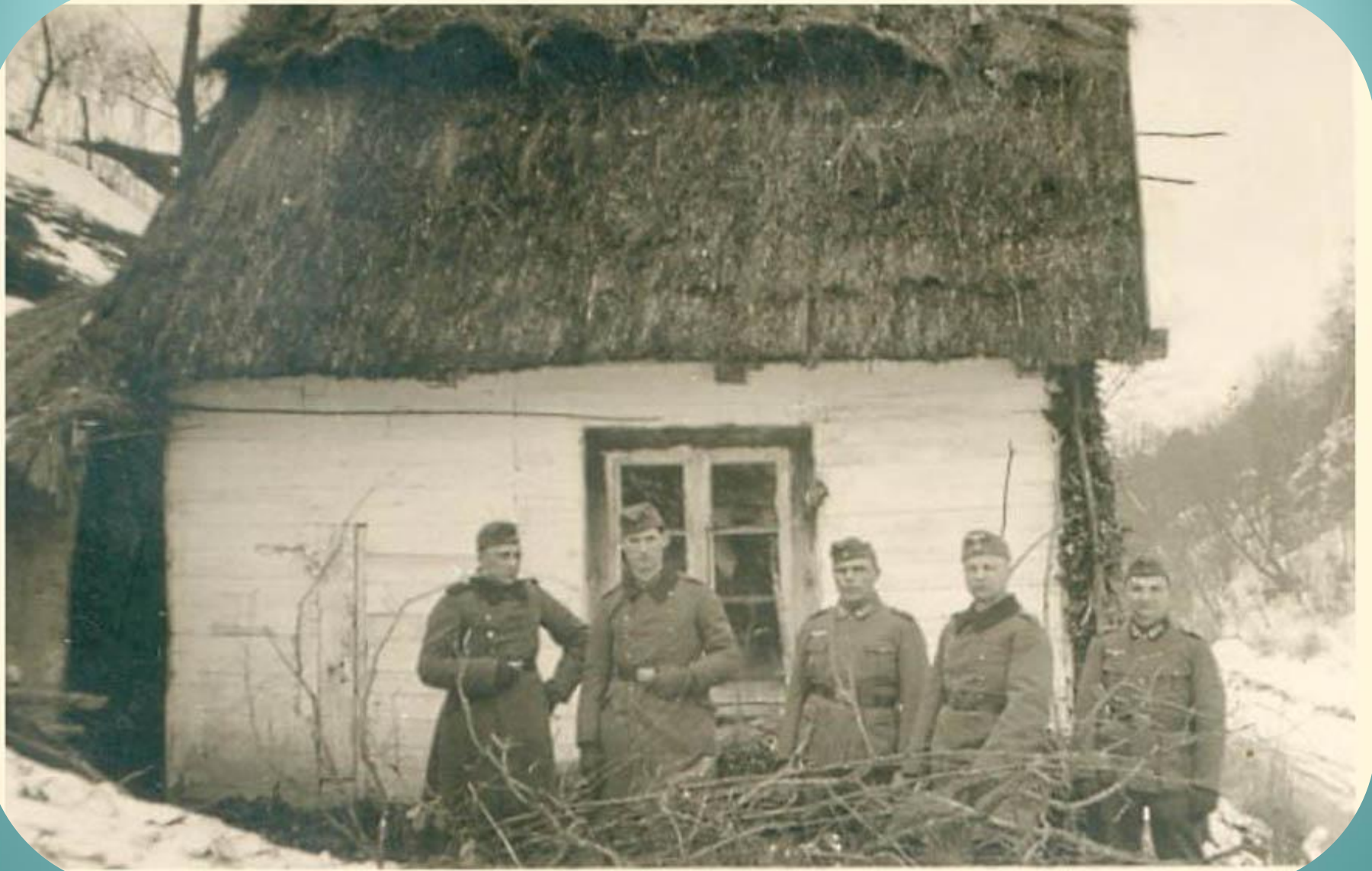
В Куракино квартировал батальон немецкой 1-й горнострелковой дивизии