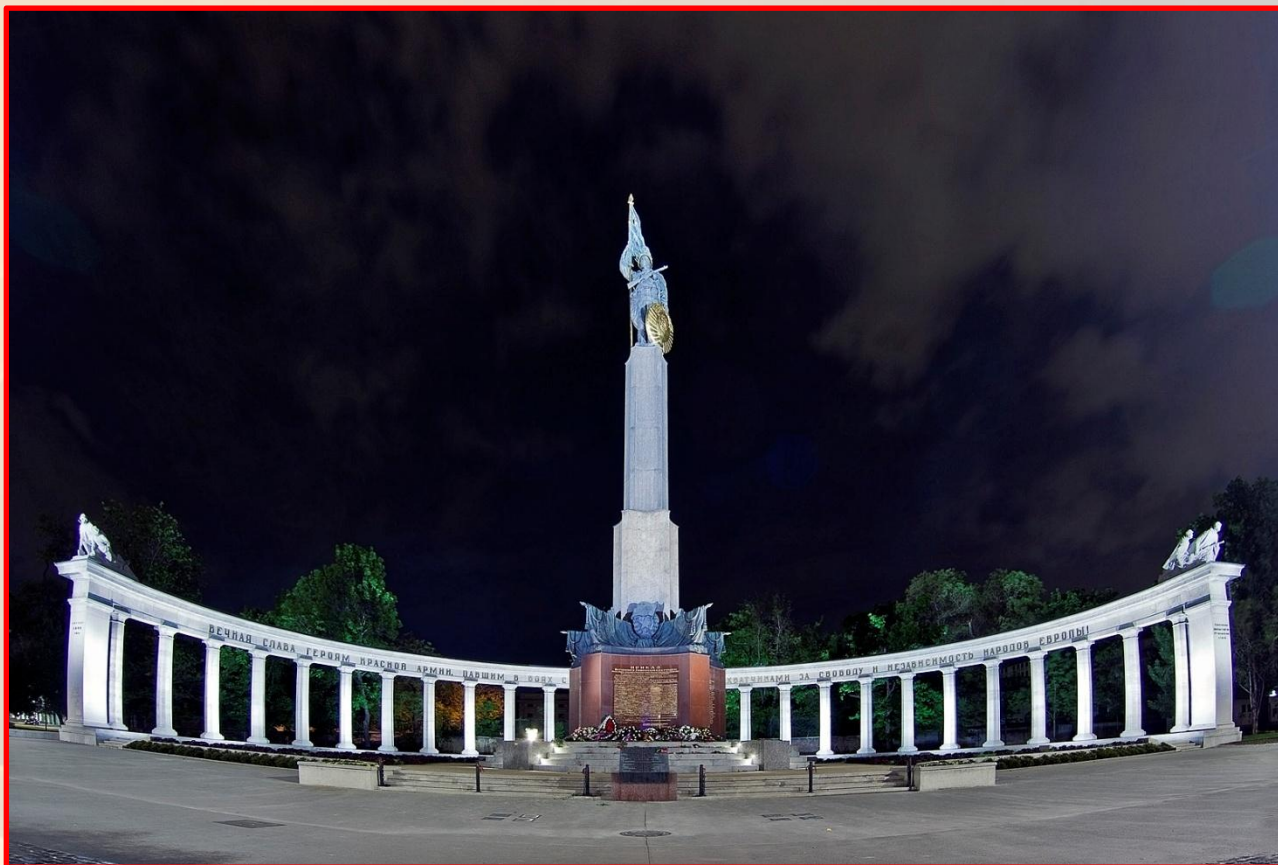
Памятник Советским воинам в Вене