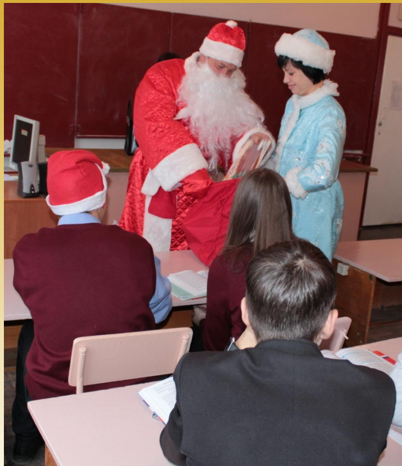
Сюрприз от родителей