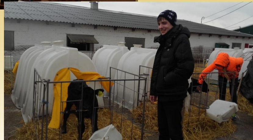
Поездка по родному колхозу