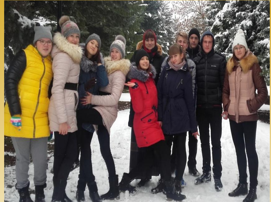
Походы на природу

-это способ организации яркой, наполненной трудом, творчеством и общением жизни единого коллектива классного руководителя и воспитанников. Дело это — творческое, коллективное, потому что представляет собой совместный поиск лучших решений жизненно важной задачи; потому что оно творится сообща — не только выполняется, но и организуется, задумывается, планируется, оценивается также совместно.