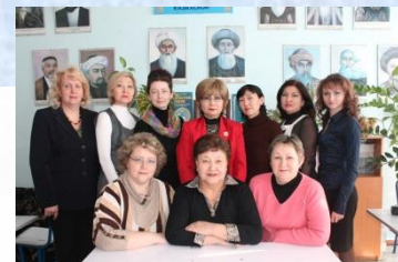
Группа учащихся старших классов