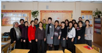
Связь с вузами