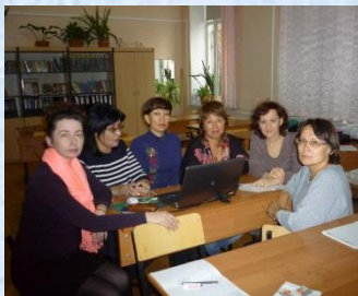
Группа молодых учителей