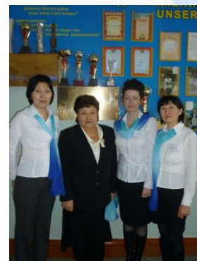
Группа МО учителей