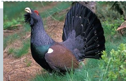
Дикуша или каменный глухарь