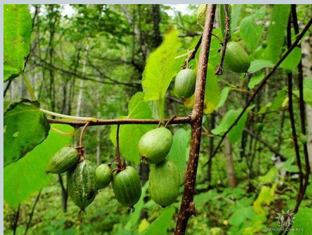
Актинидия или «КИШМЫШ»