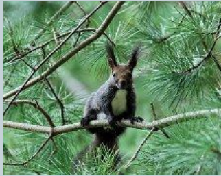
белка - летяга