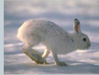
заяц - беляк