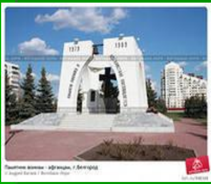
Приветствие молодежи в аэропорту, г. Дудинка.