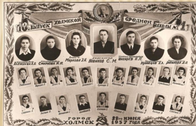
10-й выпуск Холмской СШ №1, г. Холмск, п-в Сахалин, 22-го июня 1957 г.