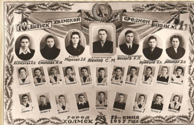
10-й выпуск Холмской СШ №1, г. Холмск, п-в Сахалин, 22-го июня 1957 г.