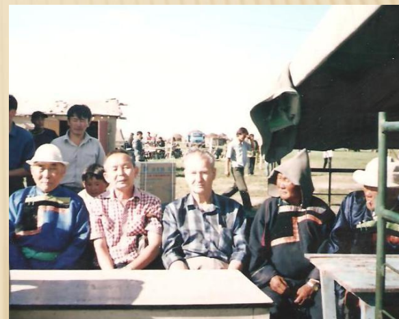
На свадьбе у бурят, Шенехенский район в Бурятии