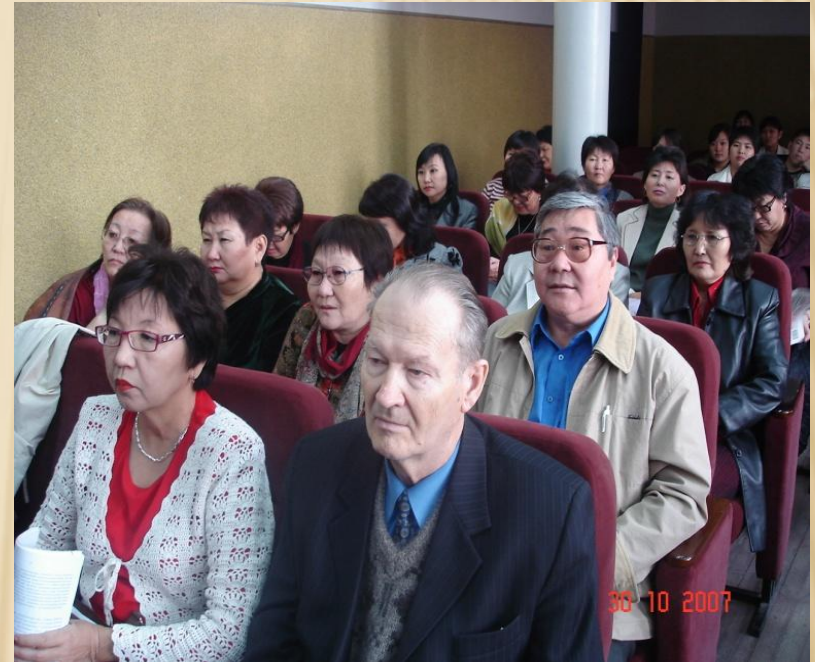
Международная конференция «Живой язык», г.Элиста, октябрь 2007г.