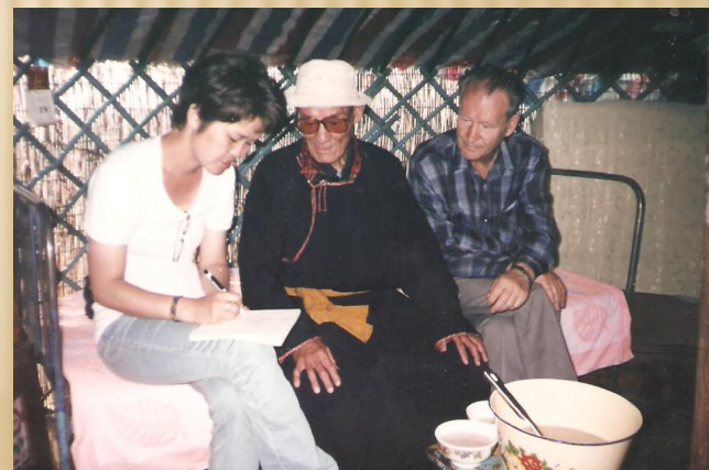
Старый баргут в юрте, учёный секретарь Саяна