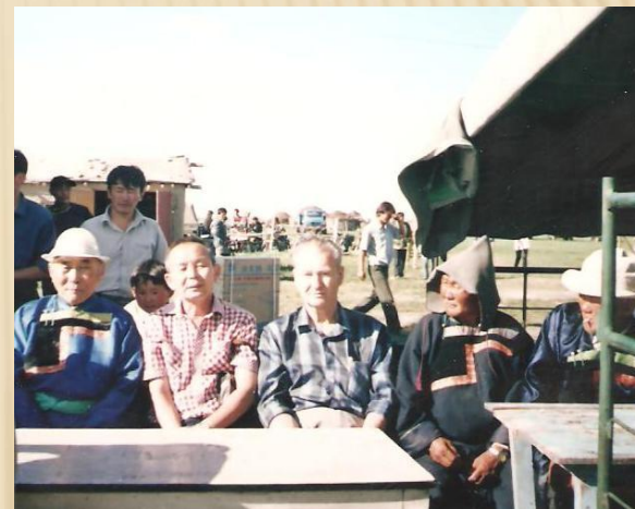
На свадьбе у бурят, Шенехенский район в Бурятии