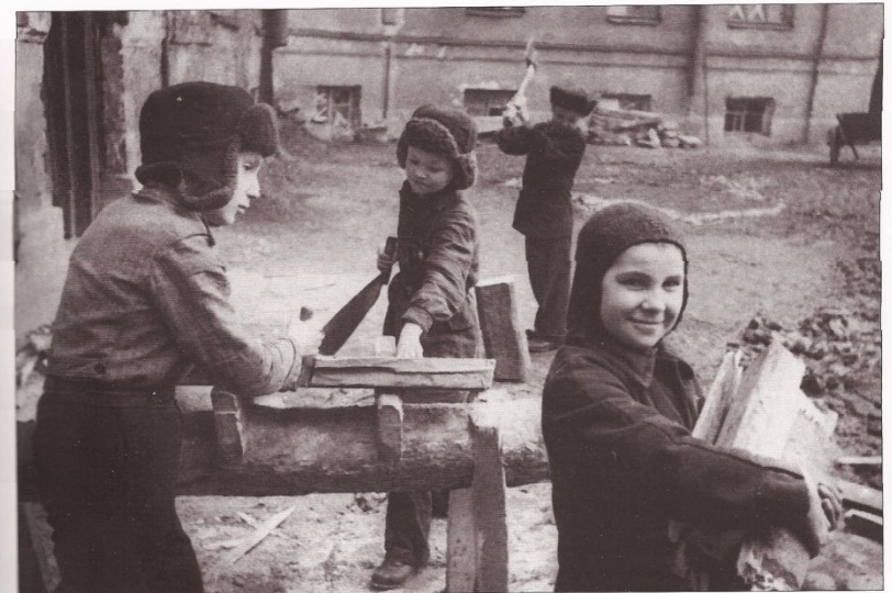
Ребята-тимуровцы за работой. [1941–1944 гг.], Ленинград.