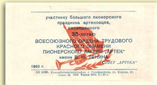
Приглашение на праздник.