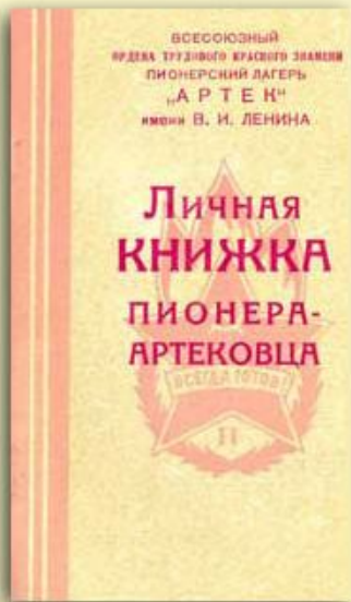
«Личная книжка» артековца образца 1958 и начала 60-х годов