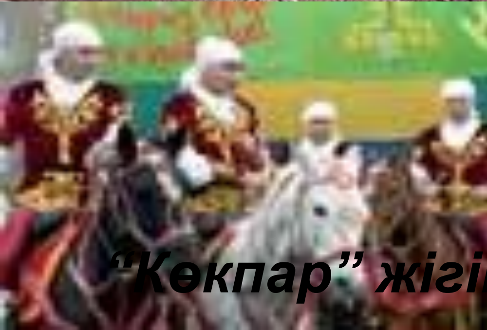
“Көкпар” жігіттер ойыны