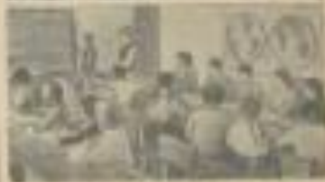
Снова в школе! Дети возвращаются в школу после каникул.

Снова в школе! Дети возвращаются в школу после каникул. Каждый из них должен учиться на его примере.