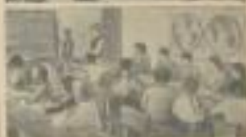
В школе. Дети возвращаются в школу. Дети возвращаются в школу. Дети возвращаются в школу.