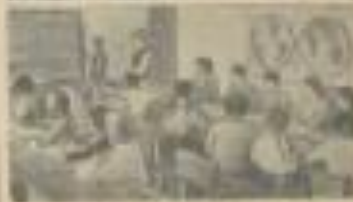
Снова в школе! Снова в школе! Снова в школе!