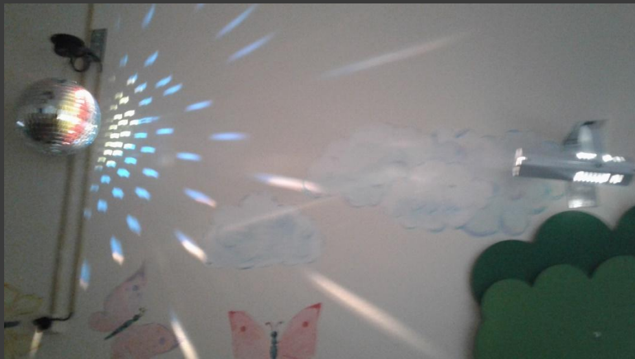
Проектор/световой «Вращающиеся лучи»