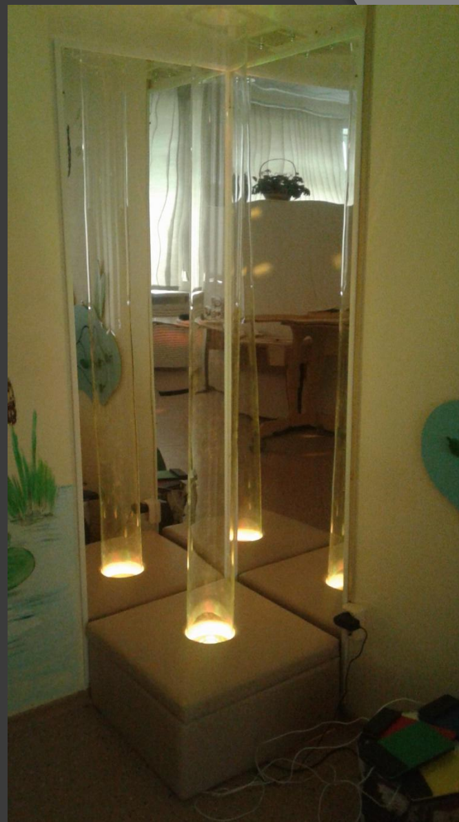
Воздушно пузырьковая колонна