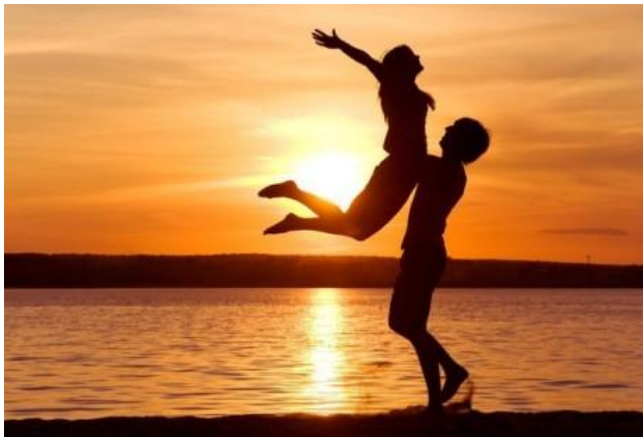
Выбор любимого человека