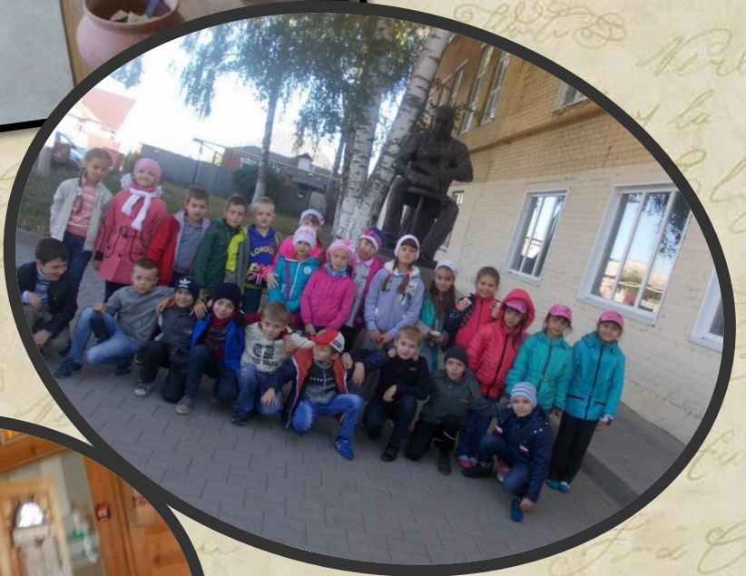
Экскурсия в «Сырный дом» пос. Томаровка Белгородской области 2015 год