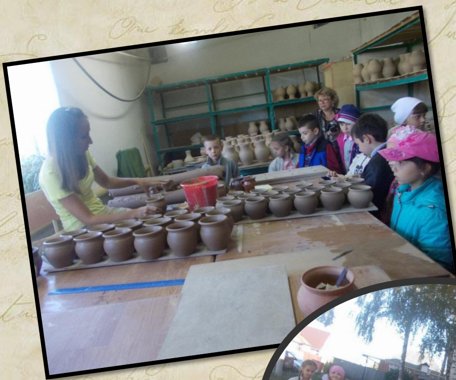
Экскурсия 2 «В» класса на керамическую Фабрику в пос. Борисовка Белгородской обл. 2015 год