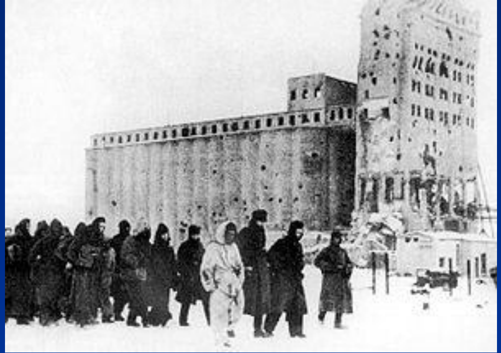
Пленённые под Сталинградом немецкие солдаты. Февраль 1943 года

Капитулировала северная группа немецко-фашистских войск в заводском районе Сталинграда. Свыше 40 тысяч солдат и офицеров под командованием генерала Штереккера сложили оружие. Боевые действия на берегу Волги прекратились.