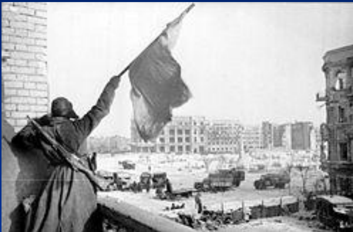
Флаг над освобождённым городом, Сталинград

О потерях Красной Армии, гражданского населения историки все еще не имеют точных данных, но ясно: они очень велики. И тем ценнее Сталинградская победа.