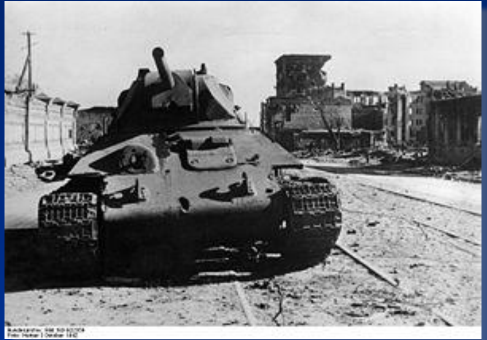
Подбитый советский танк T-34 в Сталинграде, 8 октября 8 октября 1942 года