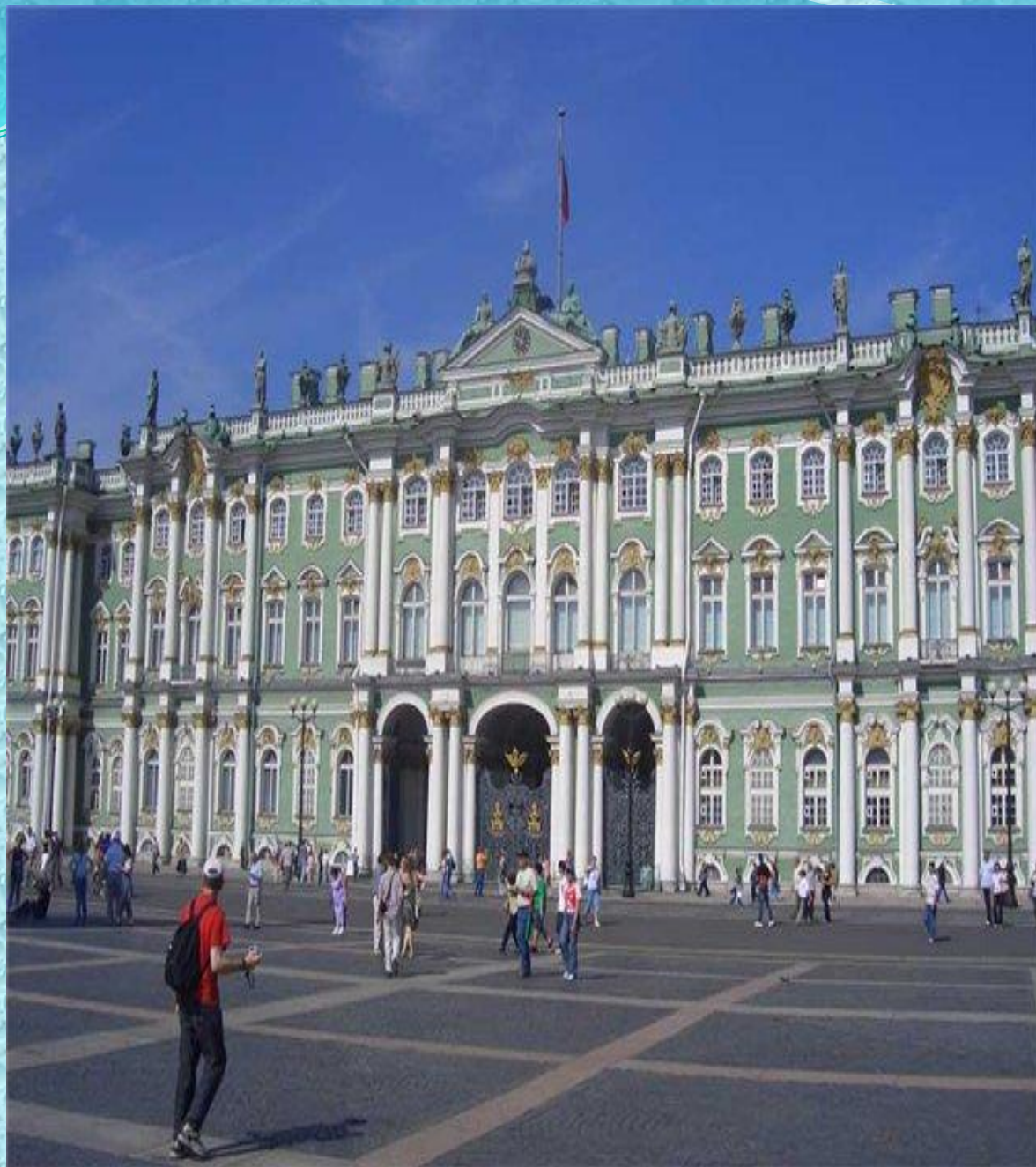
Государственный Эрмитаж в Санкт- Петербурге.