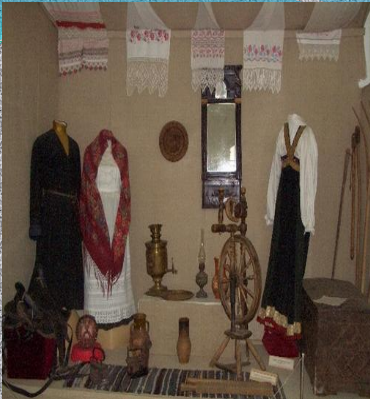
Краеведческий музей в Петергофе.