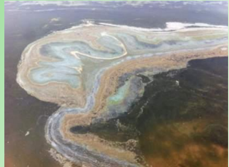
Загрязнение в местах неорганизованного туризма