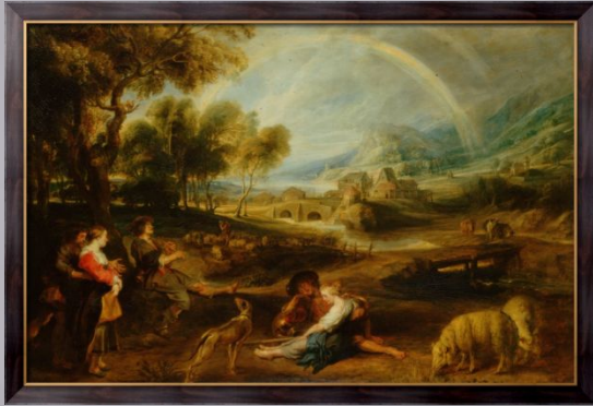
Пейзаж с радугой Рубенс, Питер Пауль