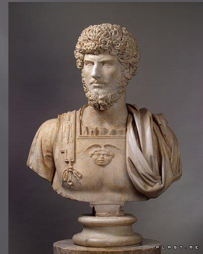
Бюст императора Люция Вера