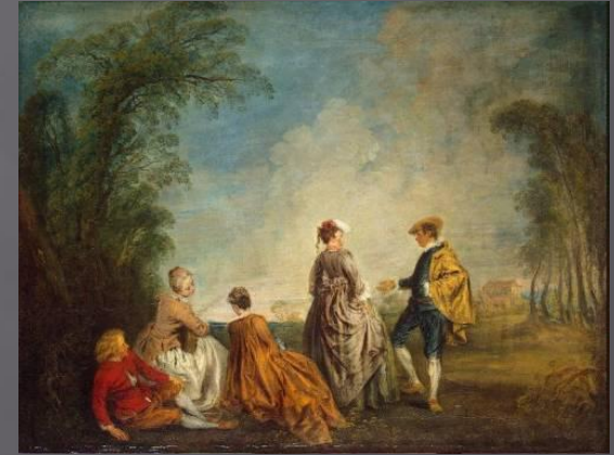
Затруднительное предложение. Антуан Ватто.