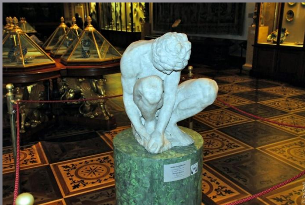
Скорчившийся мальчик (1520-1530гг) Микельанджело