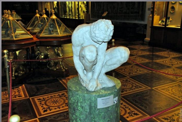
Скорчившийся мальчик (1520-1530гг) Микельанджело