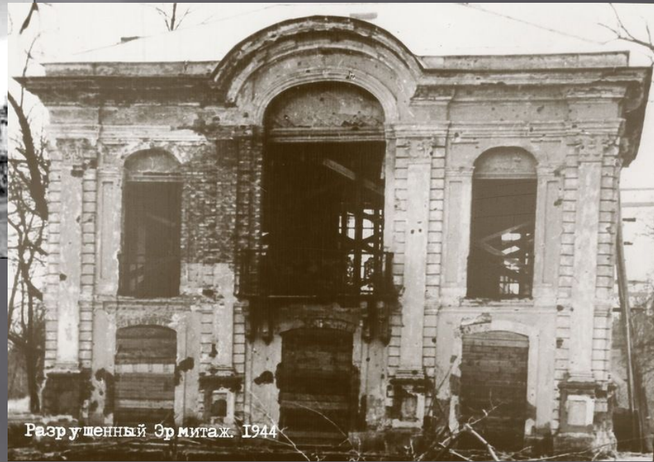
Разрушенный Эрмитаж. 1944