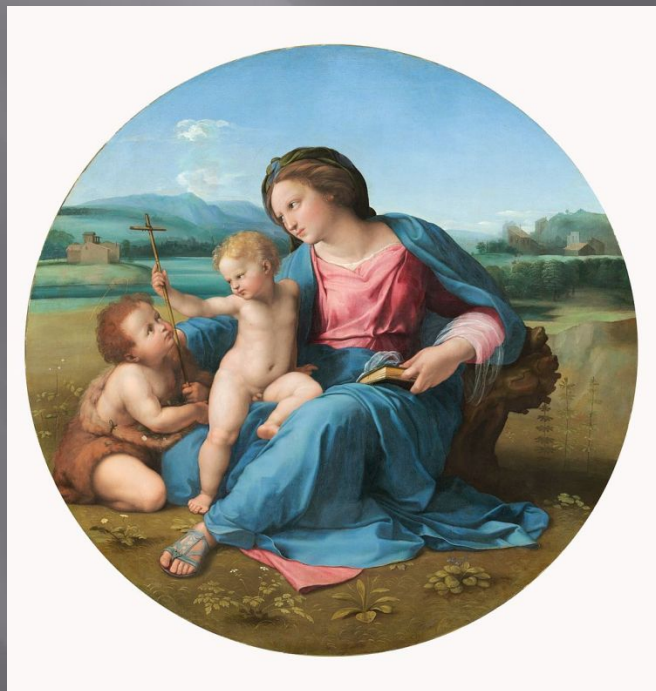
Рафаэль, «Мадонна Альба»