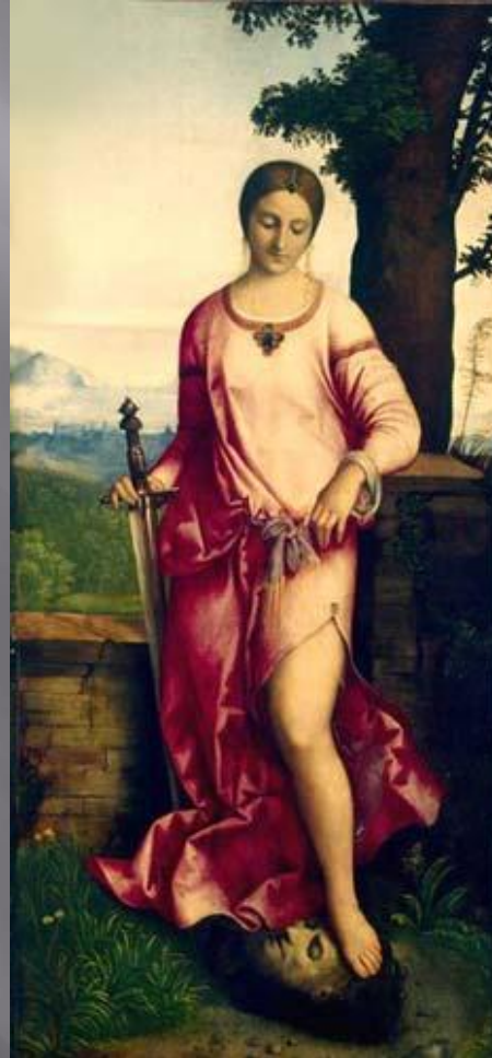
Юдифь - Джорджоне