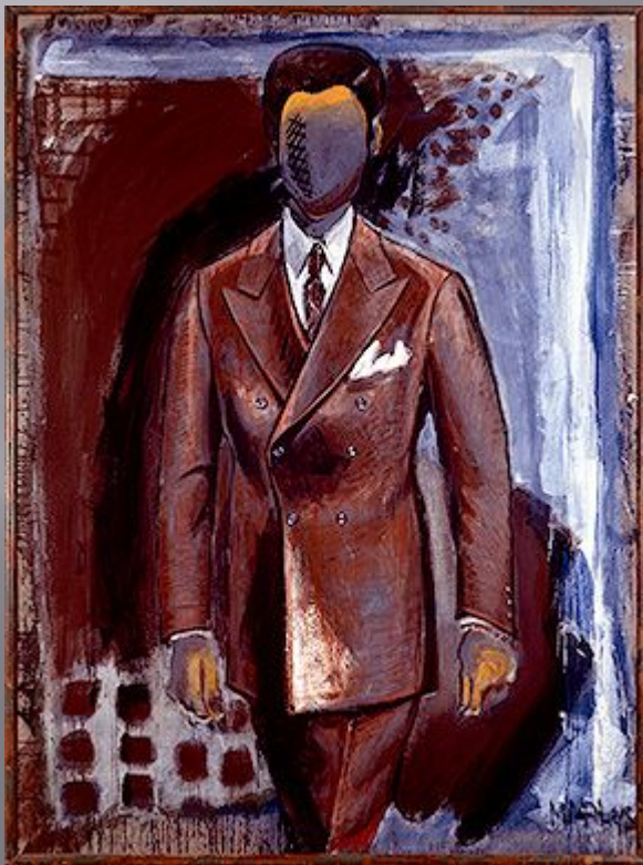
Мужчина в костюме. Дифирамбический Маркус Люперц

В постсоветское время Эрмитаж стал предпринимать усилия по заполнению лакун в собрании искусства XX и XXI веков.. Был организован Международный фонд друзей Эрмитажа. В 2002 г. экспозиция пополнилась одной из версий «Чёрного квадрата» Малевича. В 2006 году заработал Проект Эрмитаж 20/21, направленный на показ и приобретение современного искусства.