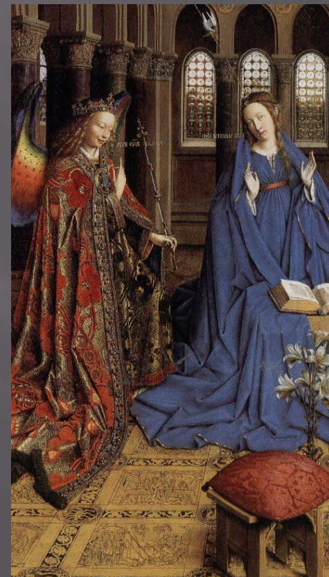
Ян ван Эйк. "Благовещение"