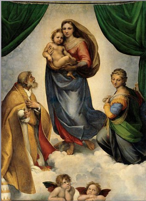
«Сикстинская Мадонна» Рафаэль

По окончании войны в Эрмитаж поступило трофейное искусство из музеев Берлина, включая Пергамский алтарь и ряд экспонатов Египетского музея. В 1954 г. была организована постоянная выставка этих поступлений, после чего советское правительство по просьбе правительства ГДР согласилось вернуть их в Берлин, что и было осуществлено в 1958 г. В начале 1957 года открылся для посетителей третий этаж Зимнего дворца, где были выставлены произведения из Музея нового западного искусства.