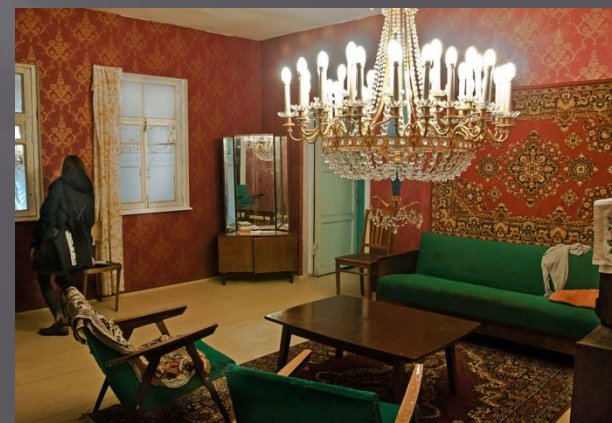
Тацу Ниси. Проект для «Манифесты 10» Государственном Эрмитаже в зале Зимнего дворца. 2014