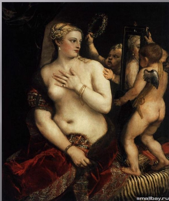
Венера перед зеркалом", картина Тициан Вечеллио

После падения императорской власти Эрмитаж претерпел существенные преобразования. Музей значительно обогатился за счет национализированных частных коллекций и собрания Академии художеств . Вместе с тем, имели место и тяжелые потери. Императорская рентерия (или Бриллиантовая комната) Зимнего Дворца была переведена в московский Кремль, послужив основой для Алмазного Фонда. Непоправимый урон собранию нанесли распродажи в 1929-34 годах, в результате которых 48 шедевров навсегда покинули Россию