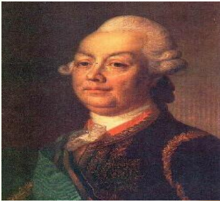
Пётр Александрович Румя́нцев-Задуна́йский