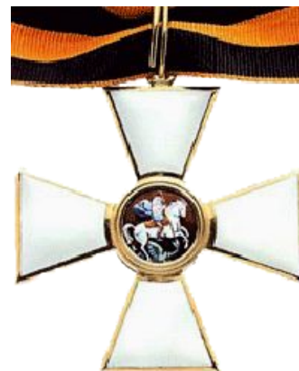
Орден Святого Георгия