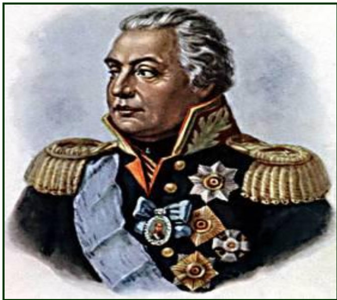
Михаил Илларионович Кутузов