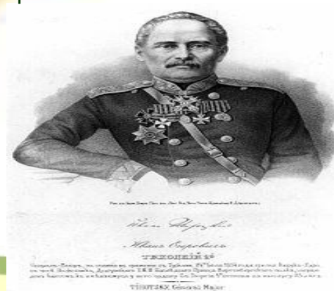
Генерал-майор И. Е. Тихоцкий