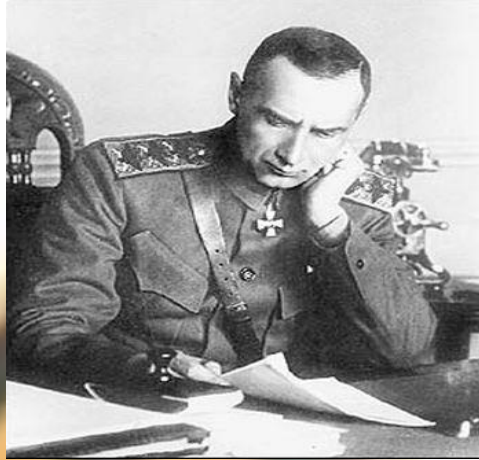
Верховный Правитель России и Верховный Главнокомандующий Русской армией адмирал А. В. Колчак