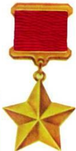
Звезда Героя Советского Союза