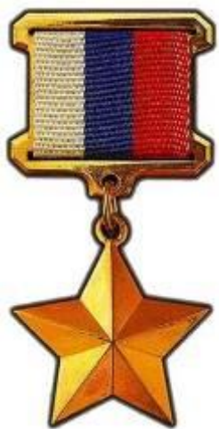
Звезда Героя Российской Федерации