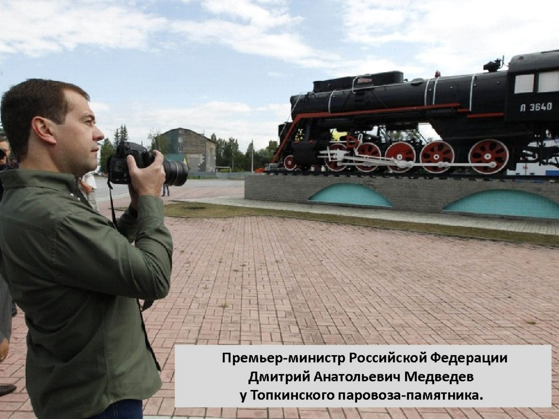
Премьер-министр Российской Федерации Дмитрий Анатольевич Медведев у Топкинского паровоза-памятника.