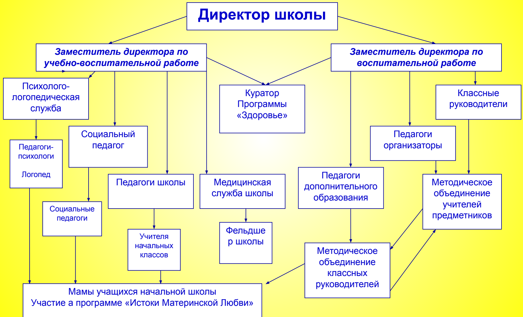
Схема соподчинения служб школы по реализации программы