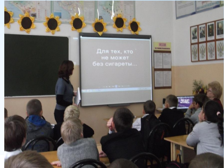
Органы УСЗН проводят мероприятие по здоровому образу жизни «Всемирный день борьбы с курением»