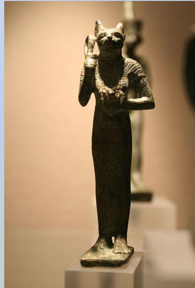
Культ кошки в Древнем Египте. Богиня Бастет

Этой богине посвящались молитвы: «Она может даровать жизнь и силу, всё здоровье и радость сердца» или «Я кошка, мать жизни». В её честь кошкам поклонялись, их мумифицировали, рядом клали мышь, чтобы кошкам было чем развлечься и питаться в загробном мире.