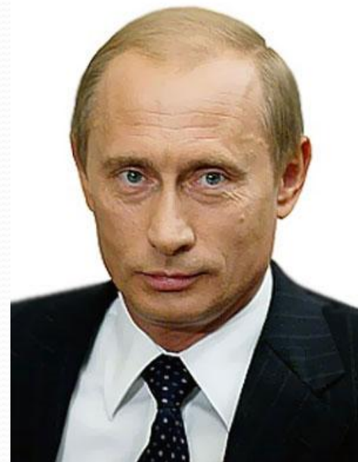
В. В. Путин

Над принятием законов думают сотни людей, а над тем, как обойти закон, думают миллионы.