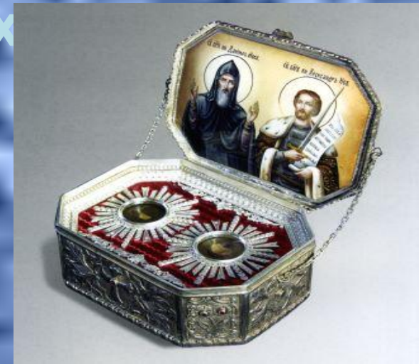
Ковчег с мощами святых благодарных князей Александра Невского и Даниила Московского.