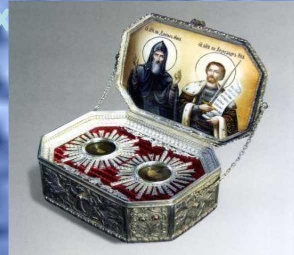
Ковчег с мощами святых благодарных князей Александра Невского и Даниила Московского.