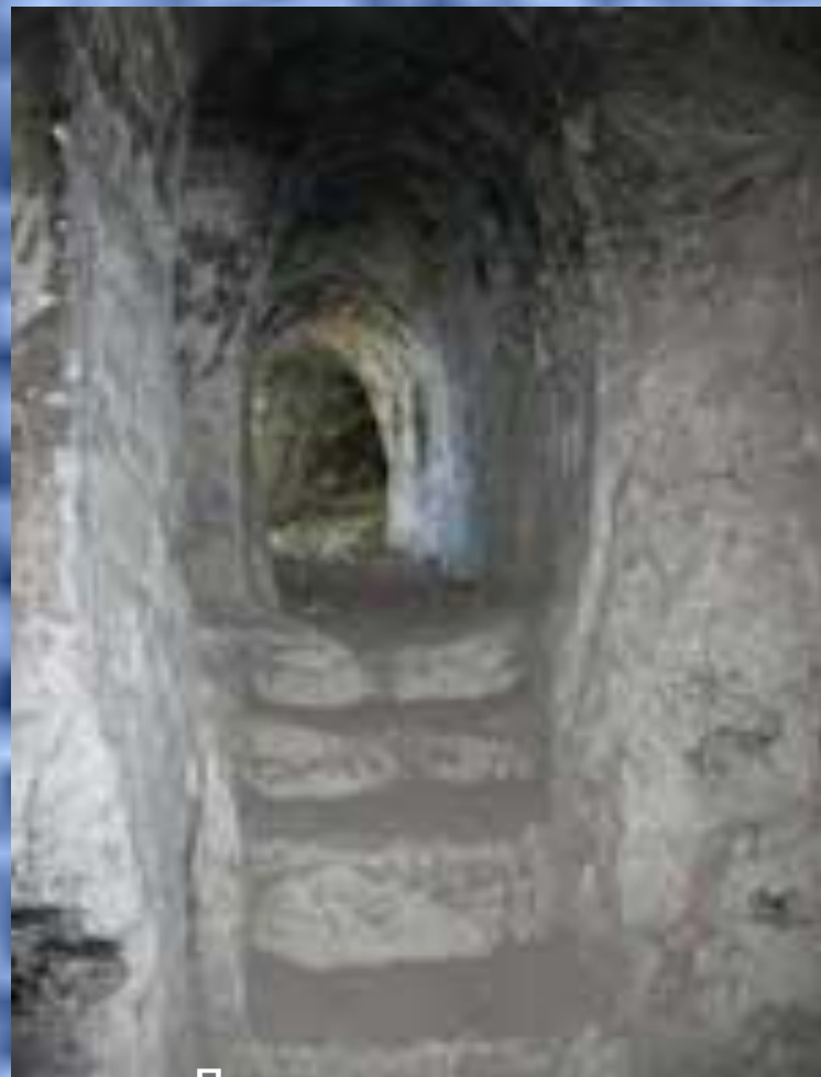
Лестница внутри Белогорских пещер