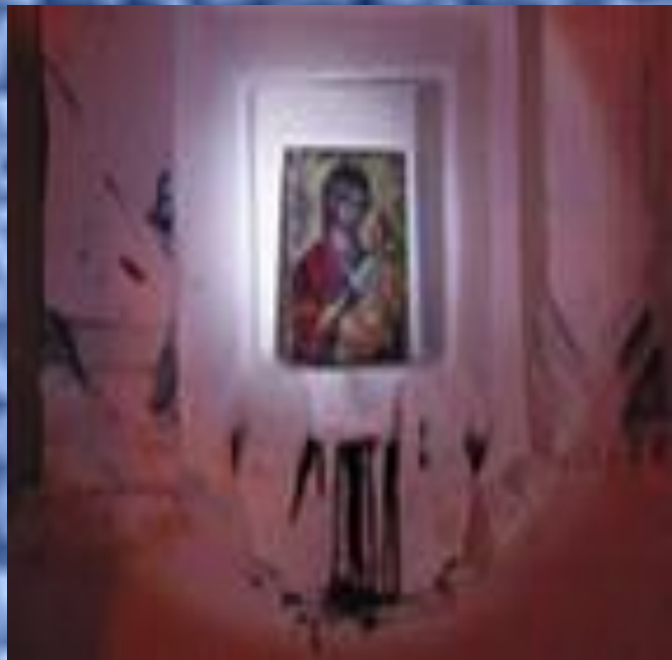
Икона Божьей Матери "Семистрельная"