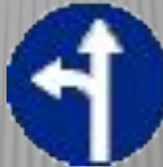
Движение прямо или налево