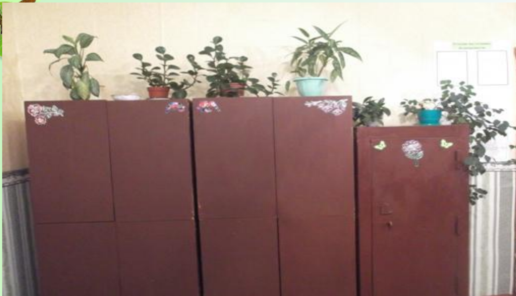
Шкафы для хранения методической литературы