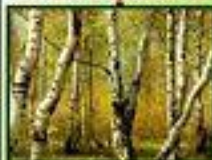
Природный заказник «Русский лес»