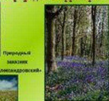
Природный заказник «Алмазковский»